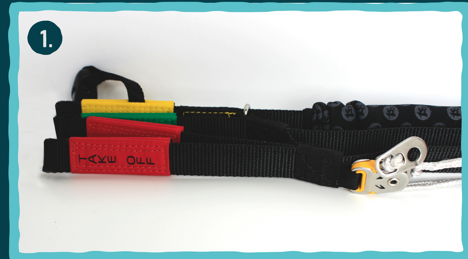
Tragegurt im nicht beschleunigten Zustand.