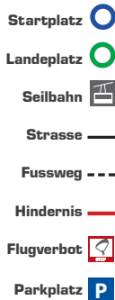
Reproduziert mit Bewilligung von swisstopo (JA092280)